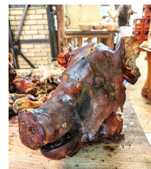
ce qu'il en reste !

Vers 15h, après un repas copieux et savoureux, une ambiance joyeuse et un peu bruyante vu le monde, il est temps de partir ! Nous prenons le bus pour nous rendre à la cité du chocolat dans le centre de Tain-l'Hermitage, par des chemins de traverse (à cause de travaux)...nous offrant une vue spectaculaire sur la vallée et les vignes environnantes !