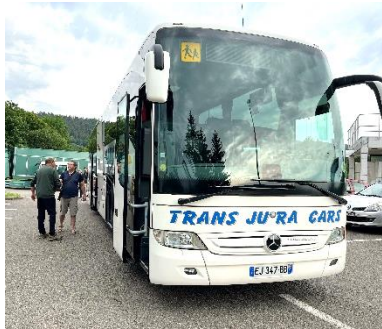
Départ du bus de Maillat avec vue des participants

Le car partait d'Oyonnax vers 8h30 en direction de Tain-l'Hermitage avec d'autres points de ramassage à Maillat et à Bourg en Bresse. Il y avait 43 participants à cette sortie et une bonne ambiance dans le bus. Nous arrivons, vers 11h00, à Mercurol directement à l'auberge paysanne « La Terrine » : le cadre est champêtre et il fait déjà super chaud !