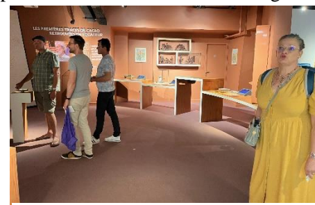
Visite d'une salle du musée

La visite de la cité du chocolat Valrhona se visite, à son rythme, selon un parcours interactif et gourmand, depuis la récolte du cacao jusqu'à la fabrication du chocolat et sa transformation par les artisans du goût avec dégustation d'une vingtaine de chocolats aux goûts différents, bien appréciés de tous ! Ainsi nous pourrions choisir nos chocolats préférés dans la boutique en face du musée avec une dégustation gratuite à l'entrée ! Quelle variété de goûts et de formats : tablettes, bâtons, carrés, coffrets et ballotins !