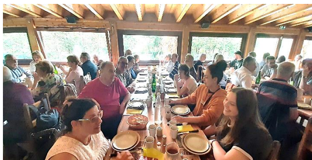
Installation du groupe dans la salle qui peut contenir 350 convives

Le menu est unique et évidemment tourne autour du cochon ! Les produits issus de la ferme seront servis du début à la fin du repas comme terrines de canard, caillettes, rillettes, pains et pognes et surtout la spécialité de l'auberge, le cochon cuit à la broche dans un four à bois situé au centre du restaurant. Il sera découpé devant nous au milieu du repas : un véritable spectacle !