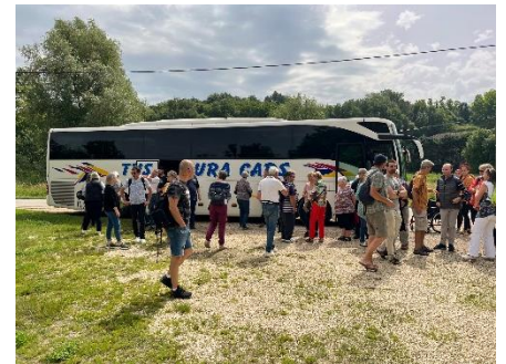
Arrivée à Mercurol

Nous commençons par une visite de la ferme avec ses parcs à cochons près d'un petit cours d'eau.