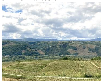
Vue sur la vallée et les vignes

Vers 15h, après un repas copieux et savoureux, une ambiance joyeuse et un peu bruyante vu le monde, il est temps de partir ! Nous prenons le bus pour nous rendre à la cité du chocolat dans le centre de Tain-l'Hermitage, par des chemins de traverse (à cause de travaux)...nous offrant une vue spectaculaire sur la vallée et les vignes environnantes !