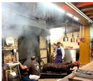
Le cochon sortant du four à bois