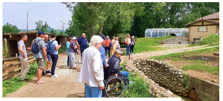
Visite de la ferme : balade autour des parcs à cochons : croisement de race