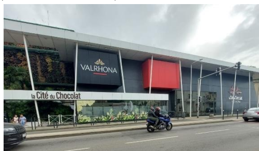
Entrée de la cité du chocolat Valrhona