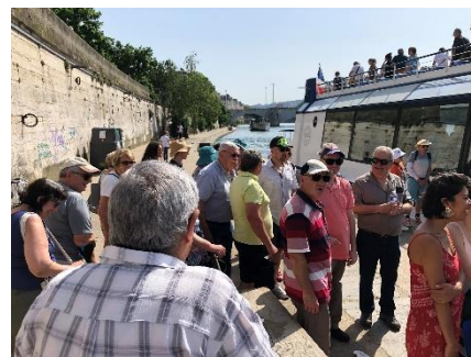
L'attente sur le quai d'embarquement pour la croisière promenade