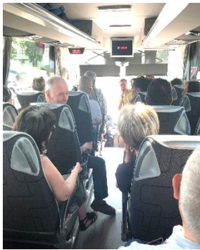
Départ du bus de Bourg avec un mot d'accueil du président

Le car partait d'Oyonnax vers 9h15 en direction de Lyon avec d'autres points de ramassage à Maillat et à Bourg en Bresse. Il y avait 39 participants à cette sortie et une bonne ambiance dans le bus. Nous arrivons directement à la Brasserie Georges : il fait déjà super chaud !