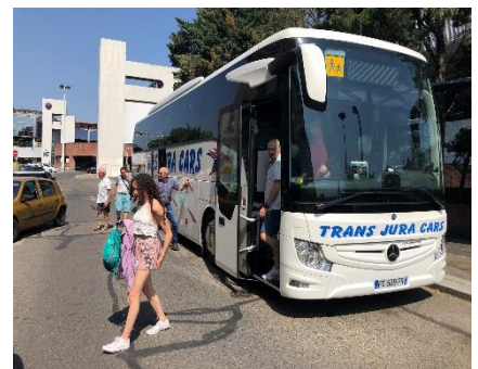
Arrivée devant la brasserie Georges

La brasserie Georges est un authentique lieu d'histoire et un rendez-vous incontournable de la gastronomie Lyonnaise. Nous apprécions la fraîcheur à l'intérieur et nous nous installons dans le salon autour de 3 tables pour un délicieux repas peut-être pas adapté à la météo ensoleillée mais il n'y a pas de saison pour manger une choucroute chez Georges !