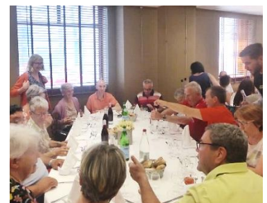
Installation du groupe dans le salon autour de 3 tables